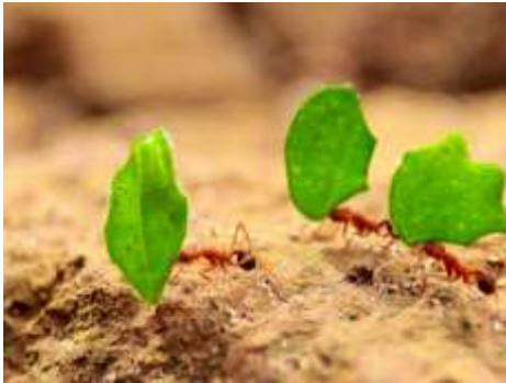
In balans / Reinout Woittiez

De foto op de voorkant van het Handboek arbeid & gezondheid heeft als titel ‘In balans’. In balans is een leidend thema in het handboek: het gaat om een balans tussen belasting en belastbaarheid en om een balans tussen werk en privé. We hopen met deze update van het handboek eraan bij te dragen dat er meer helderheid komt over de invloed van de coronacrisis op het thema arbeid & gezondheid en dat we –naar het voorbeeld van de mieren – ons gedrag aanpassen op de werkvloer en daarbuiten met als resultaat dat alle werkenden ondanks deze coronacrisis in balans blijven of weer in balans raken.